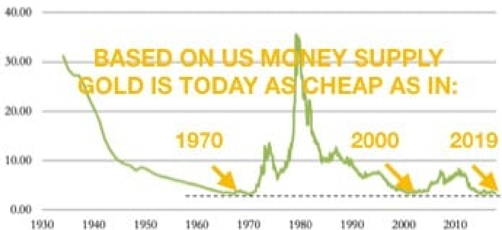
USD Gold price adjusted for FMQ since 1934

Gold ist heute so billig wie 1970 bei 35 $ und 2000 bei 270 $.