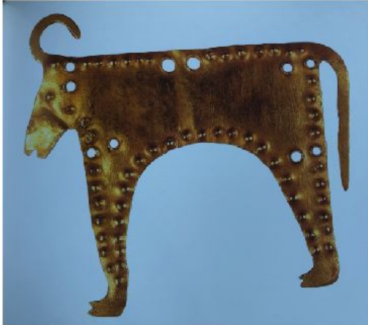
Cut-out of bull from thin gold sheet - Varna museum Bulgaria