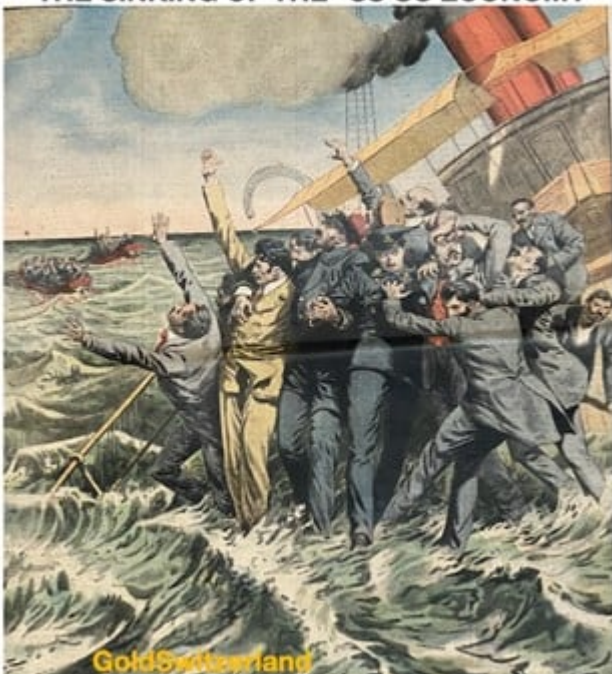
THE SINKING OF THE "SS US ECONOMY"

Eine Aufgabe, um die sie keiner beneiden kann. Denn das „Endgame“ ist praktisch schon vorgezeichnet. Schiffe können ganz schnell untergehen, oder aber sehr langsam Schiffbruch erleiden.