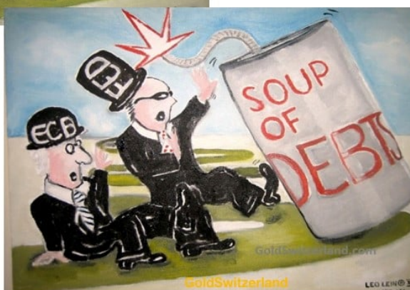
2019-23? CAN TOO BIG TO KICK