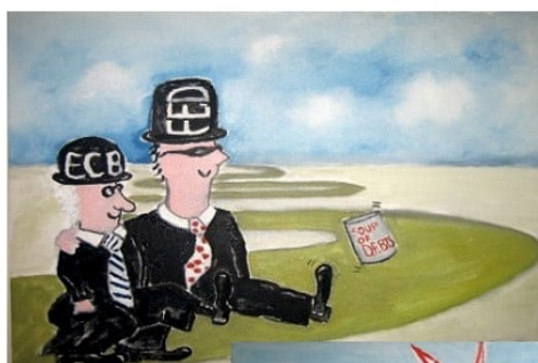
2007-9 SELF-RIGHTEOUS BANKERS KICKING CAN DOWN THE ROAD

L'effondrement économique pourra-t-il être stoppé par la TMM (théorie du toujours plus d'argent) ? Difficilement ! En 2007-2009, la Fed, la BCE et d'autres banques centrales ont réussi à repousser l'échéance et tenir le coup pendant une décennie, ce qui est remarquable si l'on considère à quel point le système était alors proche de l'effondrement total. Mais cette fois, la montagne est trop grande et rien ne pourra la déplacer.