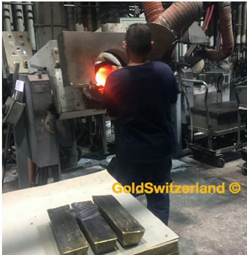
MELTING OF DORÉ GOLD BARS