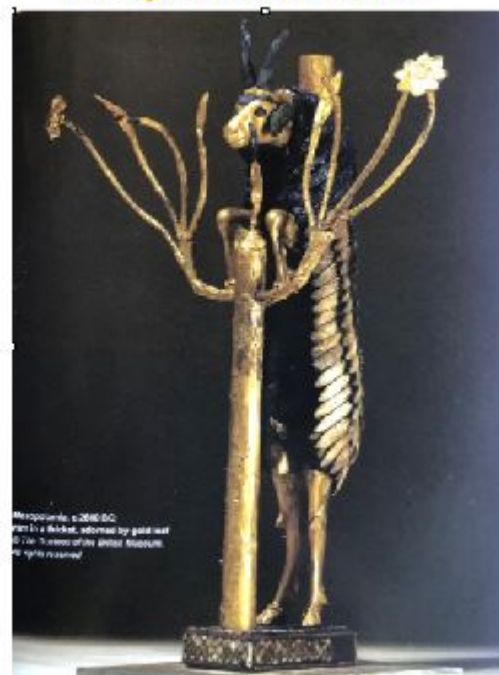
Mesopotamia, c.2600 BC Ram in a thicket, adorned by gold leaf © 1997 Trustees of the British Museum All rights reserved